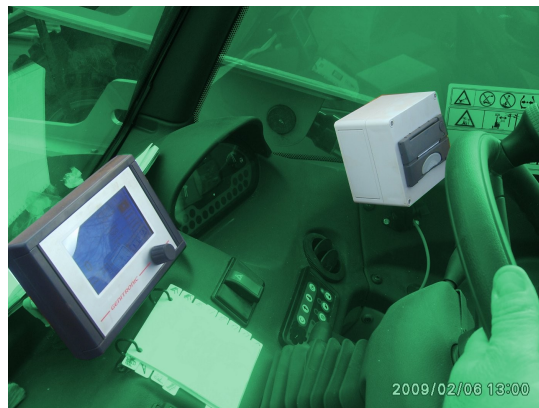
exemple de montage

impression thermique, aucune pièce fragile rouleau papier standard alimentée en 12 volts par le boîtier de pesage support articulé vissé boîtier de protection ticket paramétrable